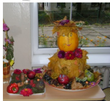
Композиція 6-В класу