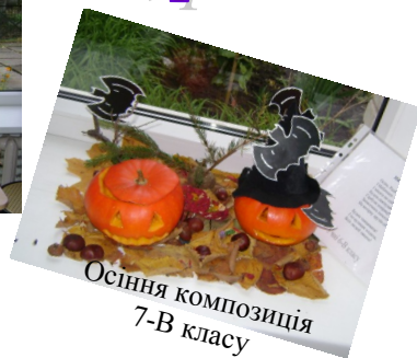
Осіня композиція 7-В класу