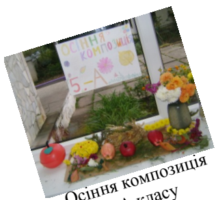
Осіня композиція 5-А класу