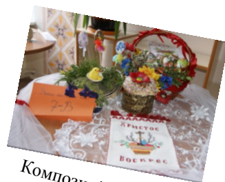
Композиція 7-В класу

Адреса: 79022 М.Львів вул.П.Полтави 32 Телефон: (32)262-40-06 Факс: (032)262-40-06