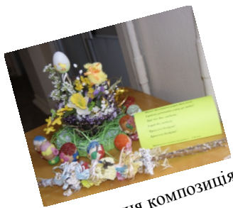
Великодня композиція 1-А класу