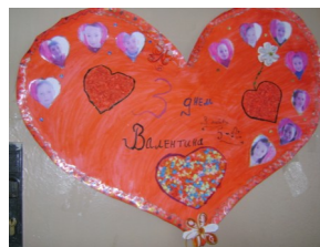
Валентинка 5-А класу