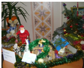
Різдвяна композиція 7-В класу